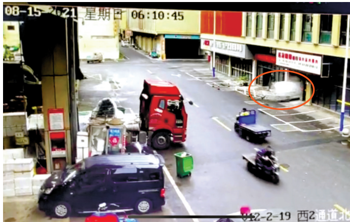
▲图示这辆货车冲进一处店面房。 ►车身飞起将店内围墙撞破并卡在了上面。

目前,对于这起交通事故的具体情况以及其中是否存在违法行为,相关部门正在进一步调查中。