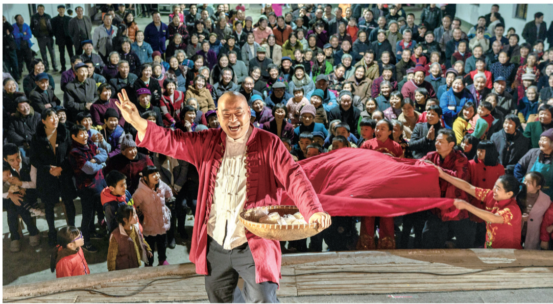
▲常山喝彩 资料图片

近日,浙江省文化和旅游厅公布2021年“浙江省民间艺术文艺之乡”名单,我市柯城区九华乡和常山县招贤镇入选。