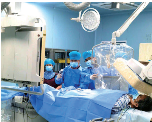
手术现场

老年男性突发胸腹部撕裂样疼痛、血压偏低,这些信号本应该引起足够的重视,可季爷爷错把胸痛当腹痛,耽搁了整整3天,好在在龙游县人民医院医护人员的救治下,他脱离了危险。