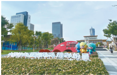
杭州亚运会临近,不少杭州市民发现身边已被亚运“三小只”包围,随处可见琮琤、莲莲、宸宸的造型,亚运氛围感满满。 据潮新闻