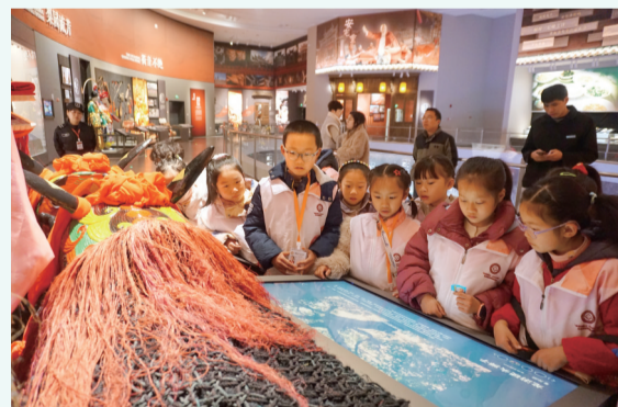
参观衢州市非遗馆。

本次“麻饼飘香话非遗,传承路上共喝彩”非遗迎春系列活动共举办了6场,吸引了150余名衢报小记者走进衢州市非遗馆。在这里,他们不仅参观了丰富多彩的非遗项目,还亲身参与体验了剪纸、叶画、糖画、喝彩等多种非遗项目,让这个寒假充满了传统文化的浓厚氛围,也让非遗技艺在孩子们心中生根发芽。