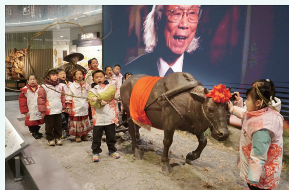
鞭春牛,吟诵喝彩歌谣。