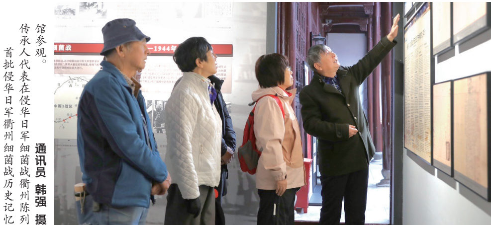
馆参观。 传承人代表在侵华日军细菌战历史记忆守护者签名的电影《731》海报,在侵华日军细菌战衢州陈列馆展出,彰显了各界捍卫历史真相的坚定决心。首批侵华日军衢州细菌战历史记忆传承人代表在参观时表示,敦促日本首相高市早苗立即撤回涉台错误言论,要求日本政府承认和反省细菌战等罪行,并向中国受害者进行谢罪和道歉。