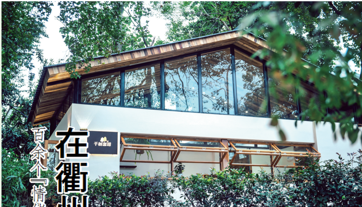
常山县“千树咖啡”。