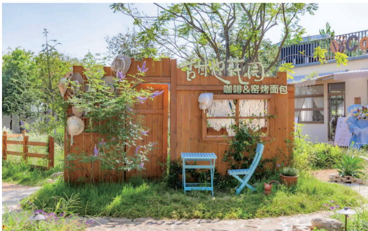
衢江区“甜也花园”。