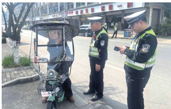
交警部门检查电动车非法加装现象。