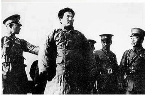
面对敌人的威逼利诱,方志敏大义凛然。

9时,眼看着敌人先头部队将进入伏击圈,一位战士不慎步枪走火,伏击战打成遭遇战,红军陷入被动。国民党援军源源不断赶来,战斗异常惨烈。