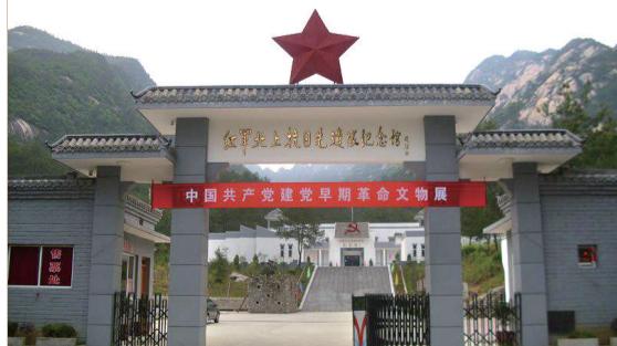
黄山谭家桥抗日先遣队陈列馆。

战斗于12月14日拂晓打响。寻淮洲主动请缨,率19师担任主攻,决心利用乌泥关至高点至谭家桥一带有利地形,伏击敌军。